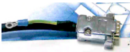
Figura b Cavo Testina-Analyzer